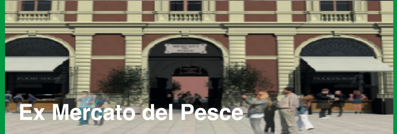
Ex Mercato del Pesce