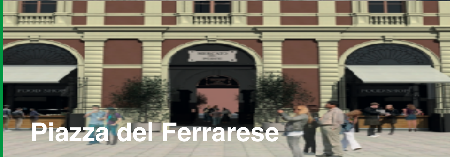
Piazza del Ferrarese